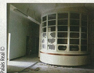
Palais Réal ©