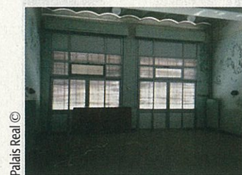
Palais Réal ©

J'étais déjà une expert-comptable et enseignante atypique, peintre du dimanche (quand j'avais encore des dimanches !) et passionnée d'art et d'architecture. C'est pour cela qu'avec le recul je pense que le hasard n'est pas le seul moteur d'un changement aussi radical. Station Alexandre, projet conduit avec l'intuition et l'énergie du renouveau, a nécessité un travail considérable. Je me revois comme une petite fourmi chargée d'un gros projet qui avance et recule à tâtonnements... Petite fourmi qui trace droit, ne se rend pas compte de l'énorme charge qu'elle porte sur son dos. Finalement, ce n'était pas plus mal ! J'ai tout découvert « sur le tas ». Je ne connaissais personne, ni au niveau politique, ni dans le monde de l'immobilier, ni aux niveaux des banques, des institutions et il y a bien des fois où il a fallu faire de gros efforts pour ouvrir les portes, « y aller » comme on dit à Marseille ! J'ai rencontré des interlocuteurs extraordinaires, suffisamment en tout cas pour m'encourager à persévérer. Ces présentations successives m'ont permis à la fois de convaincre, mais aussi de réfléchir et d'avancer à voix haute en